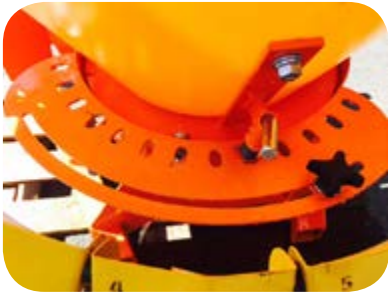
Réglage du débit et asymétrie d'épandage