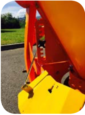
Réglage de la longueur d'épandage