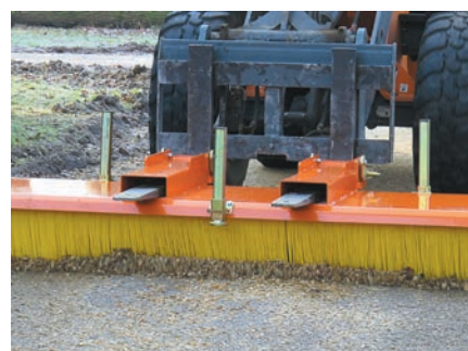
Logement palette avec blocage sans outil