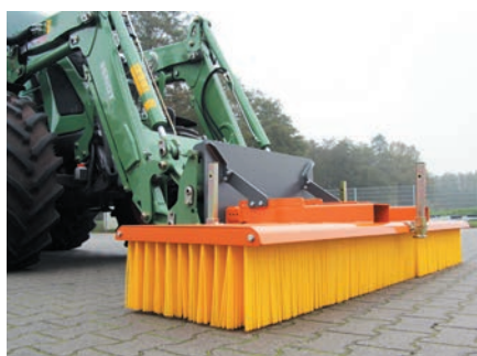
Plaque de montage rapide pour chargeur frontal