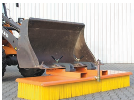
Logement pour godet y compris vis de serrage