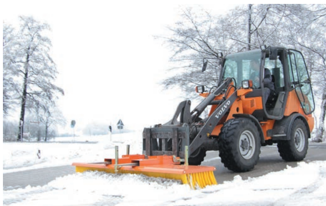
Intervention en hiver : bema 11 Multi-Clean monté sur chargeuse à pneus