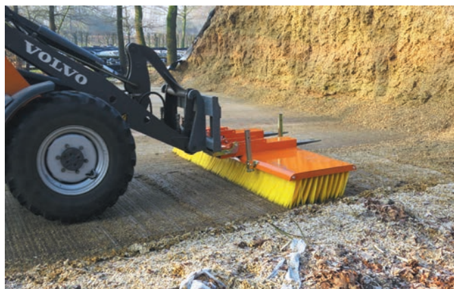
Poussage d'ensilage au moyen du bema 11 Multi-Clean