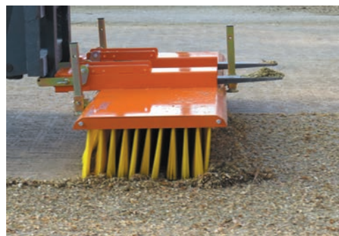
Le balai pousseur s'impose par 11 rangées de brosse