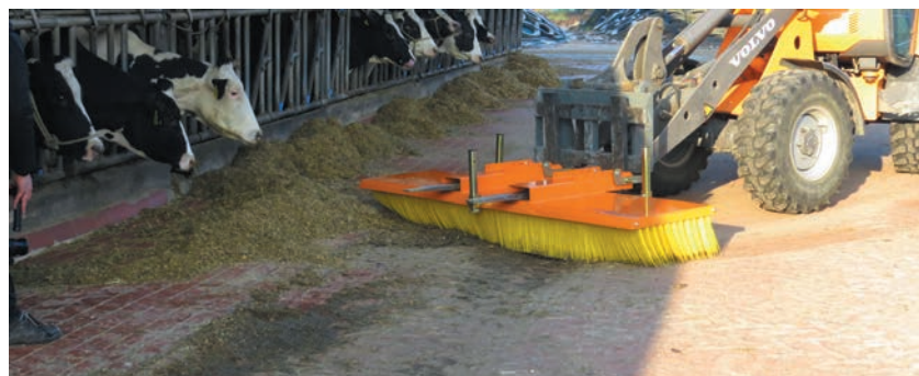
Le poussage de fourrage moyennant le bema 11 Multi-Clean ne pose aucun problème