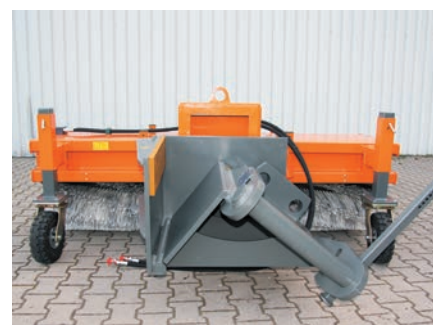
Montage pivotant sur pelleuse (montage spécifique)