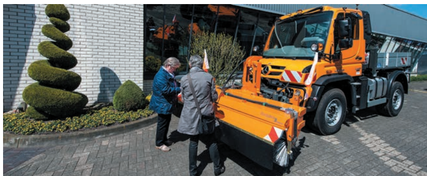
bema 3 Robust – monté sur Unimog et doté d'un déplacement latéral par hydraulique