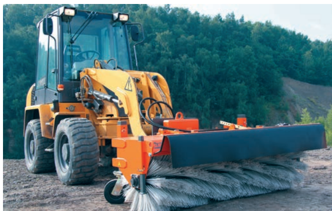
bema 3 Robust - monté sur chargeuse sur pneus et doté d'une bavette de protection