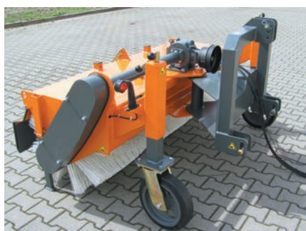
Boîte de vitesses et roues Ø 360 x 85 mm