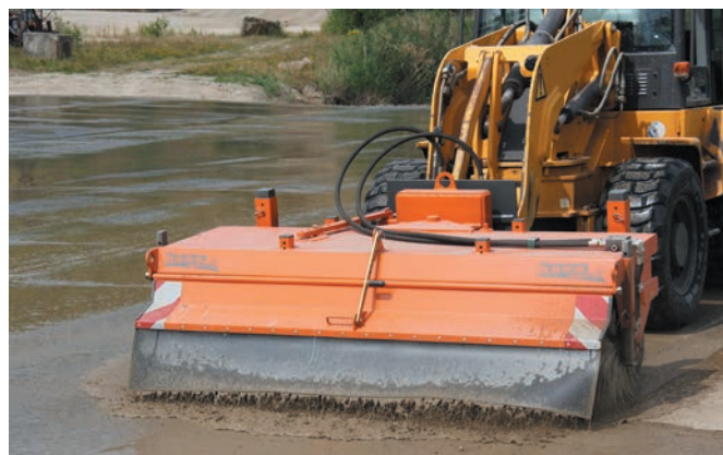
Robuste et à toute épreuve