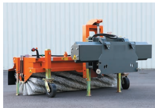
bema 3 Robust doté d'un déplacement latéral par hydraulique